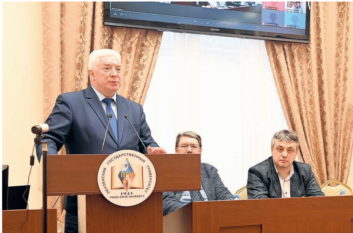
Международная научная конференция 23–24 октября 2024 г. «Сравнительное государственное и сравнительное правоведение в контексте прошлого, настоящего, будущего»