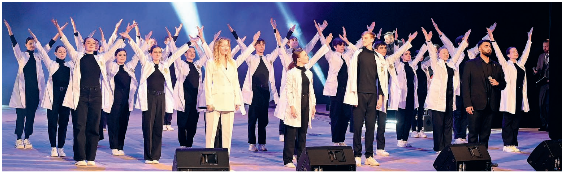
В медицинском институте обучаются более четырёх тысяч студентов