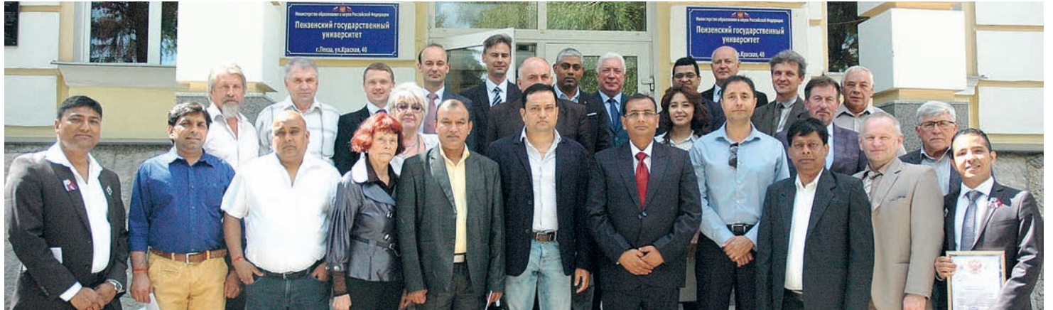
2018 г. Встреча индийских выпускников ПГУ

В Пединституте международное обучение было налажено тремя годами ранее. В