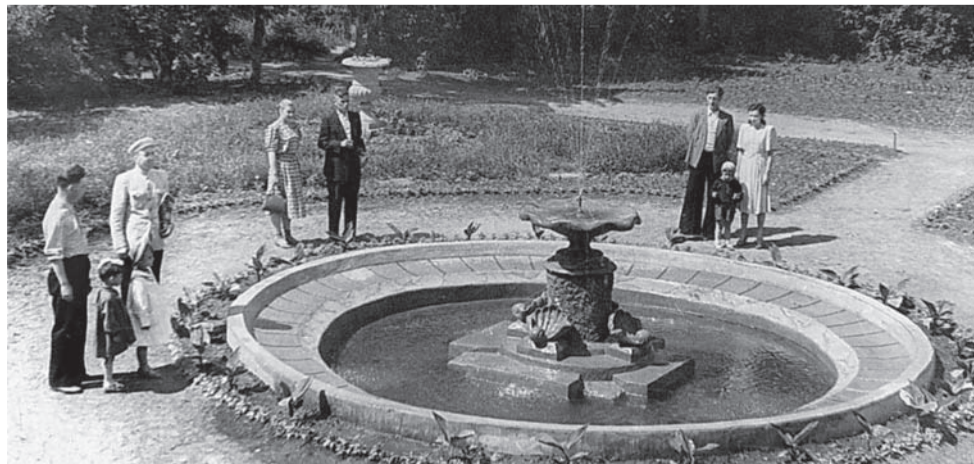
Фонтан на фасадной части ботанического сада. 1950-е гг.