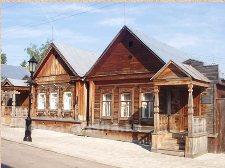
Дом-музей В.О. Ключевского в Пензе, где прошли его детские и юношеские годы

1991 – выпущена почтовая марка СССР, посвященная Ключевскому.