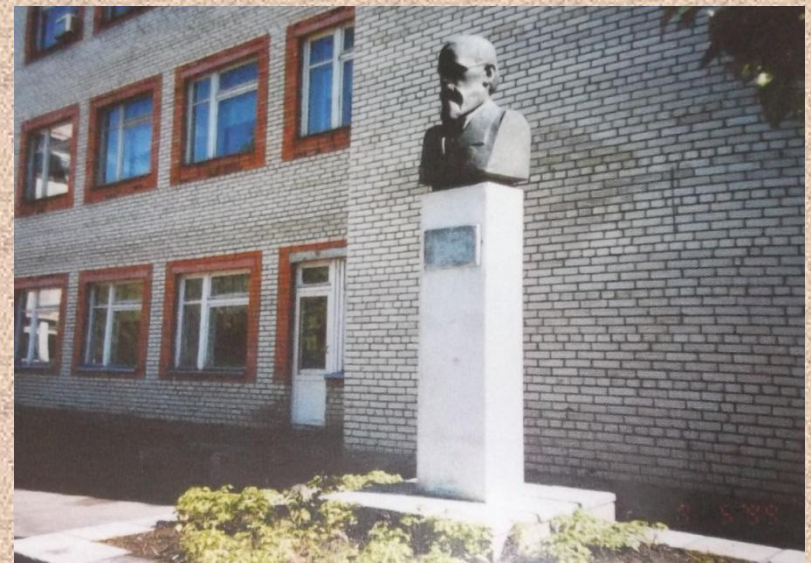
Памятник В.О. Ключевскому у школы на родине в с. Воскресеновке