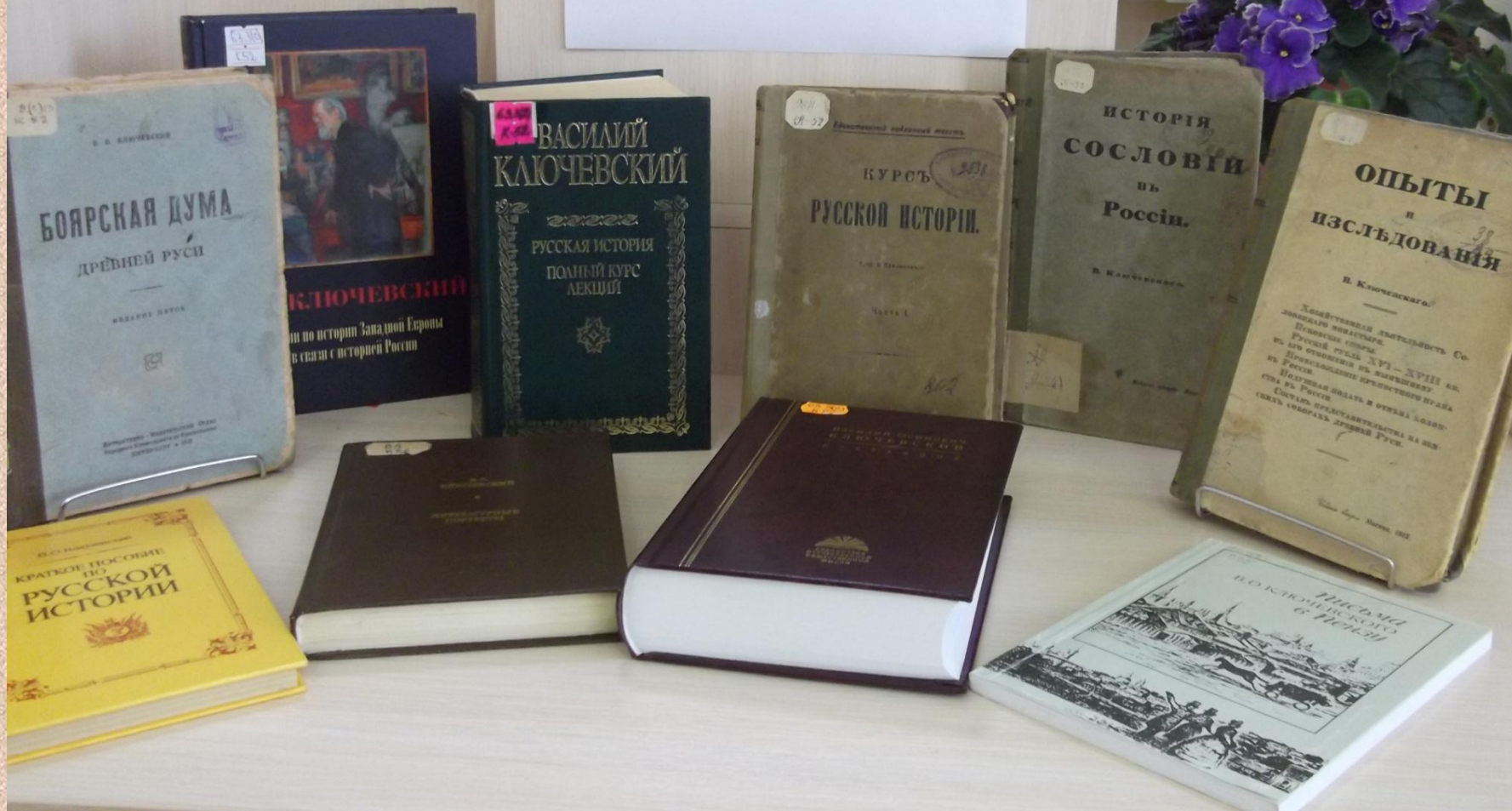
Книги из фонда библиотеки педагогического института им. В.Г. Белинского