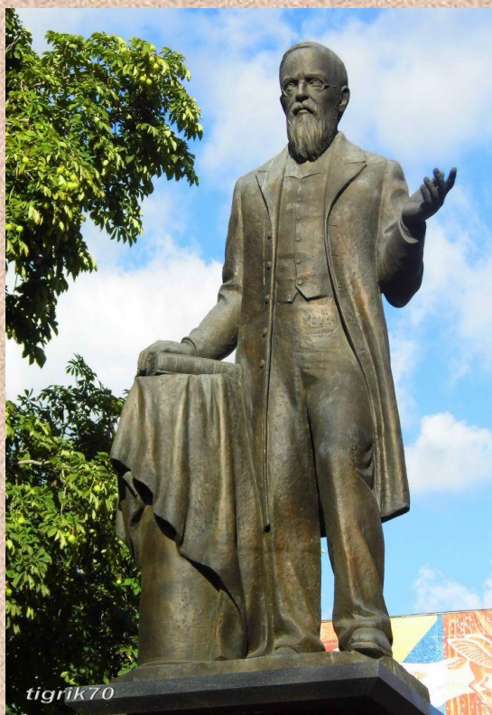
Памятник В.О. Ключевскому в Пензе

2011 – почта России выпустила памятные почтовый конверт с изображением музея Ключевского и открытку с изображением памятника В.О. Ключевскому со специальным