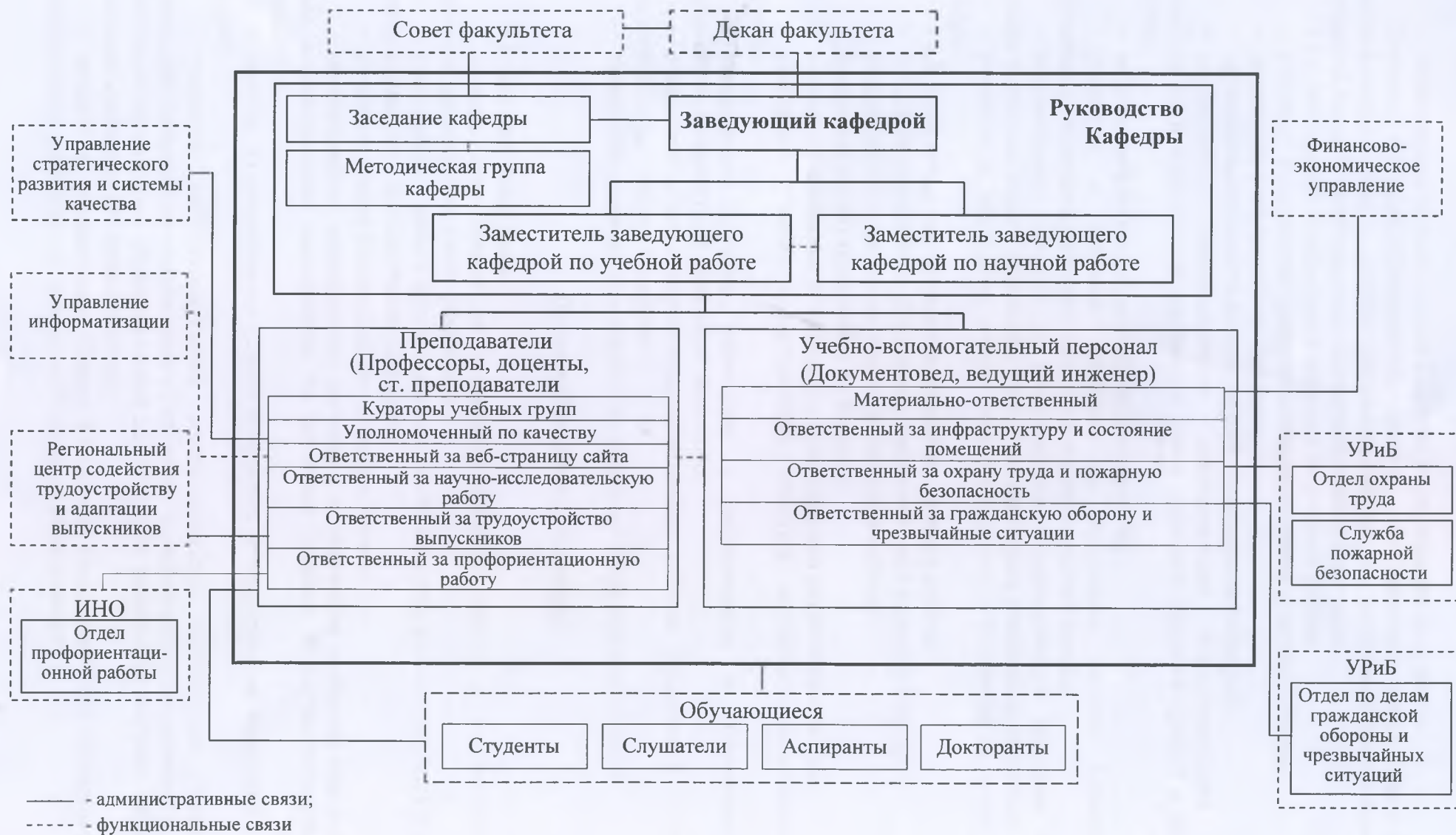
Рисунок 1 – Организационно-управленческая структура кафедры «Экономическая кибернетика»