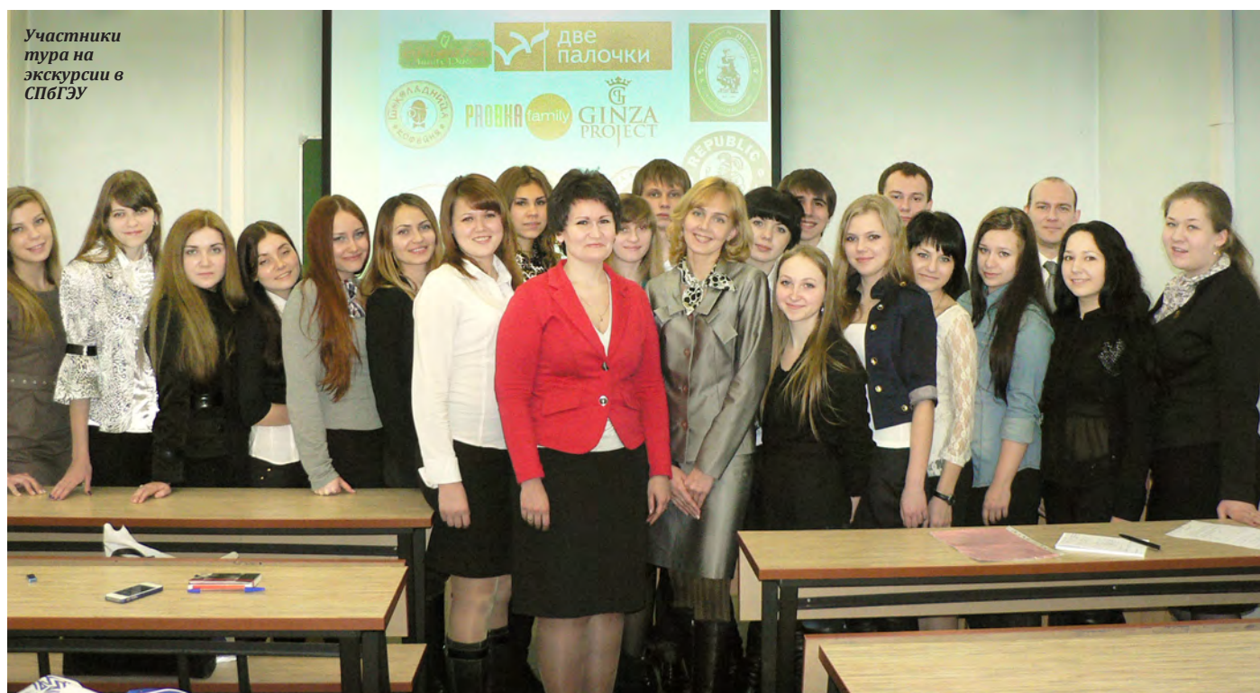
Участники тура на экскурсии в СПбГЭУ

— Мы побывали на XI Международной выставке индустрии гостеприимства «EXPOHORECA». Выставка представляла собой множество павильонов, производственных и обучающих площадок, где можно было увидеть процесс приготовления продукции общественного питания, применения того или иного оборудования. Деловая программа вы-