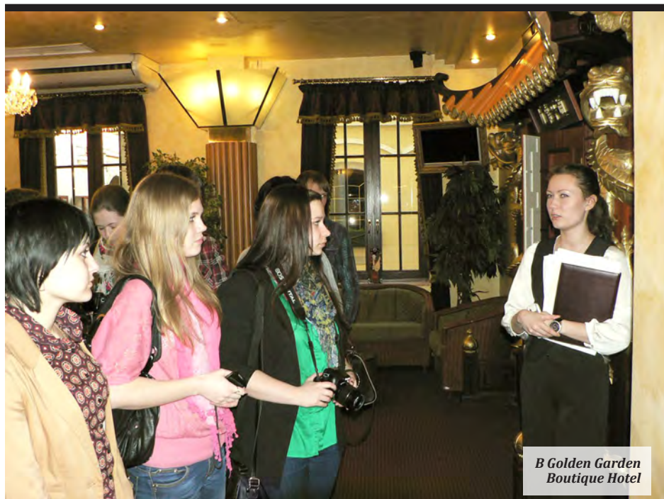
B Golden Garden Boutique Hotel

ставки включала семинары, круглые столы для профессионалов, демонстрацию оборудования и технологий, международные соревнования, мастер-классы и, конечно же, дегустации, – делится доцент кафедры «МКиСН». – Ребята могли планировать своё пребывание на выставке, выбирая интересные их мероприятия. Так, например, многие участники нашего тура посетили мастер-класс по приготовлению блюд итальянской кухни, который проводился итальянским шеф-поваром. Одним из интересовавшихся изучение барного мастерства, других – искусство эффективного общения и решения конфликтных ситуаций с гостем.