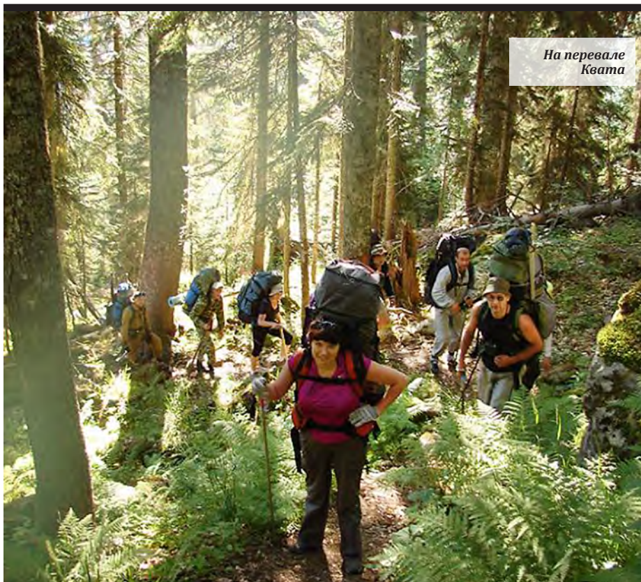
На перевале Квата