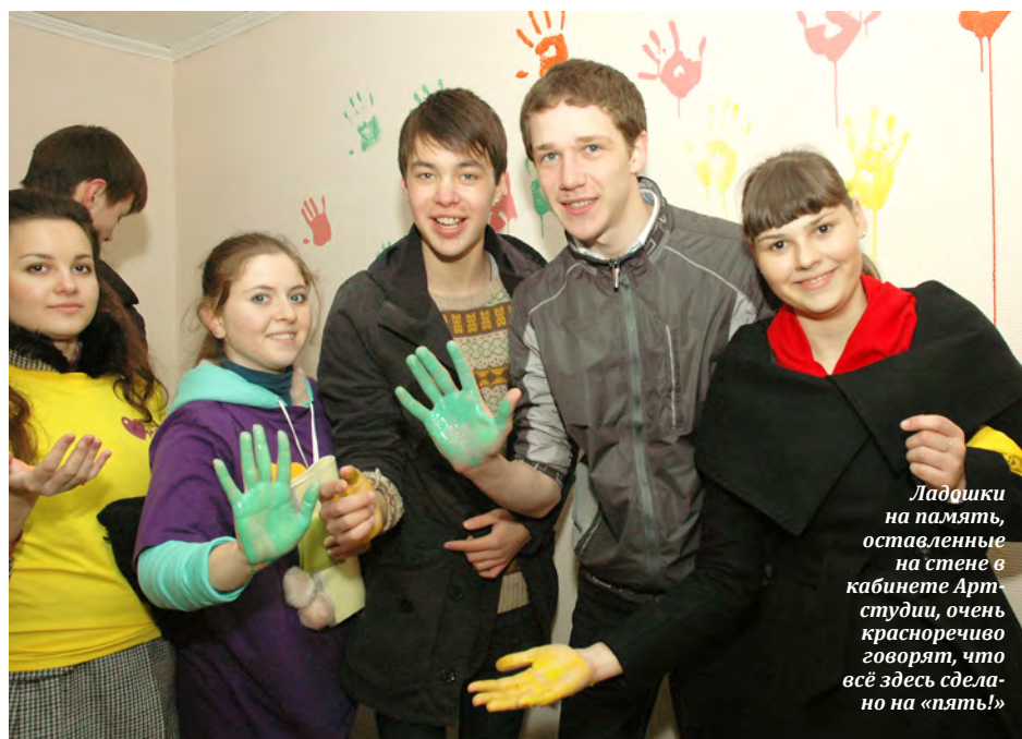
Ладочки на память, оставленные на стене в кабинете Арт-студии, очень красноречиво говорят, что всё здесь сделано на «пясть!»