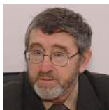
Профессор, зав. кафедрой литературы и методики её преподавания, в 1987–2003 гг. – декан факультета русского языка и литературы