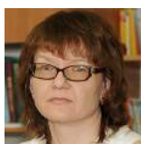
Директор музея ПГПУ, доктор исторических наук, профессор кафедры новейшей истории России и краеведения