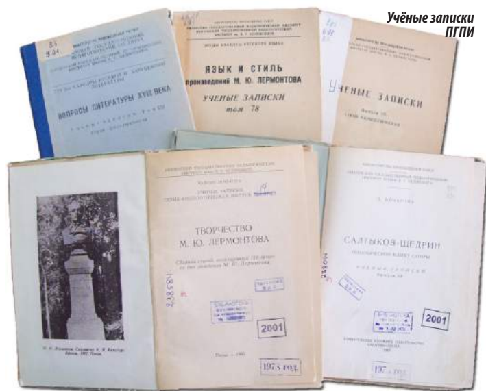
Учёные записки ПГПИ

Таким образом, к середине 50-х годов в институте сложились основные формы работы и методы руководства научной преподавательской и студенческой