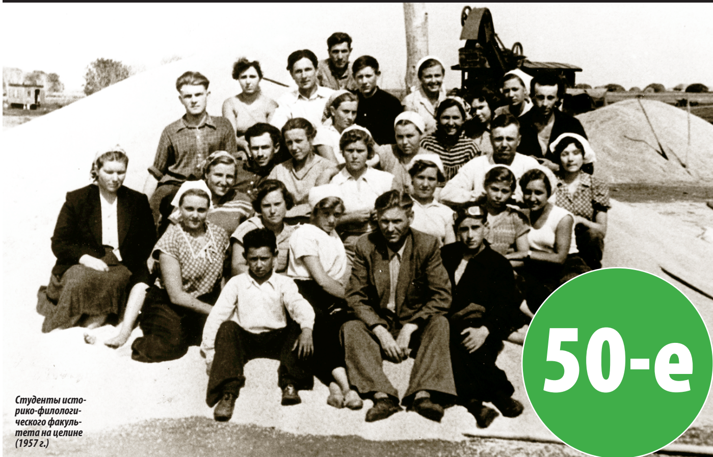
Студенты историко-филологического факультета на целине (1957 г.)