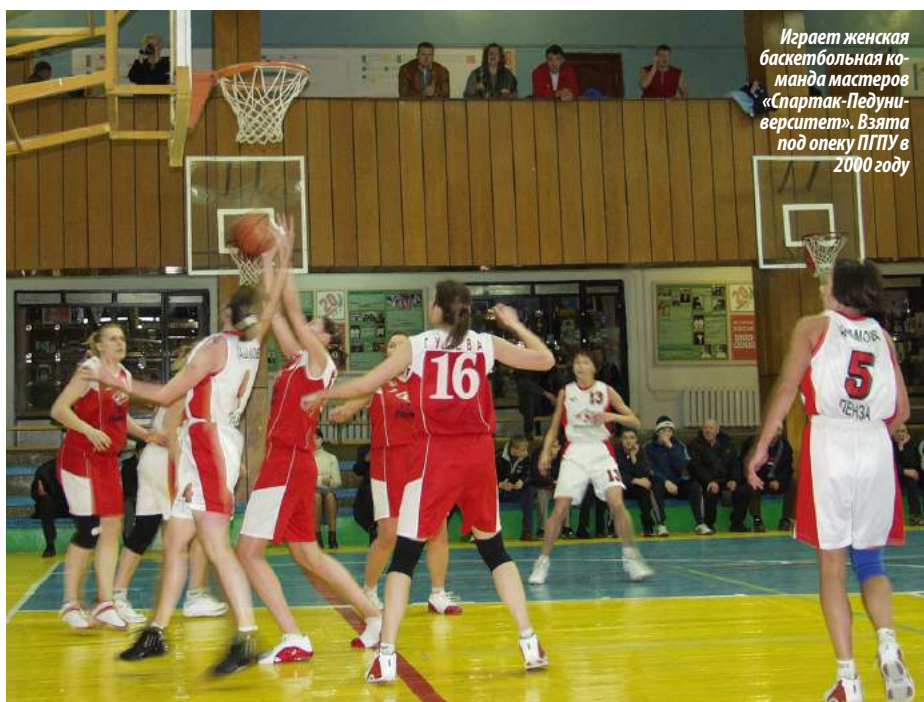
Играет женская баскетбольная ко- манда мастеров «Спартак-Педуни- верситет». Взята под опеку ПГПУ в 2000 году

Впечатляет и динамика привлечения внебюджетных средств на развитие материально-технической и научной деятельности университета. За период 2003–2008 гг. в этой сфере было освоено 27 279,3 тыс. рублей, причём в 2008 году объём доходов составил 15 894 тыс. рублей.