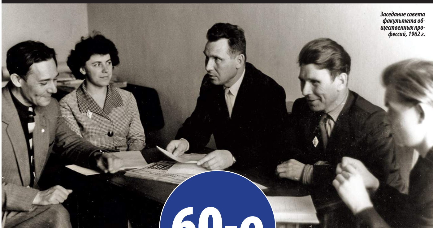
Заседание совета факультета общественных профессий, 1962 г.