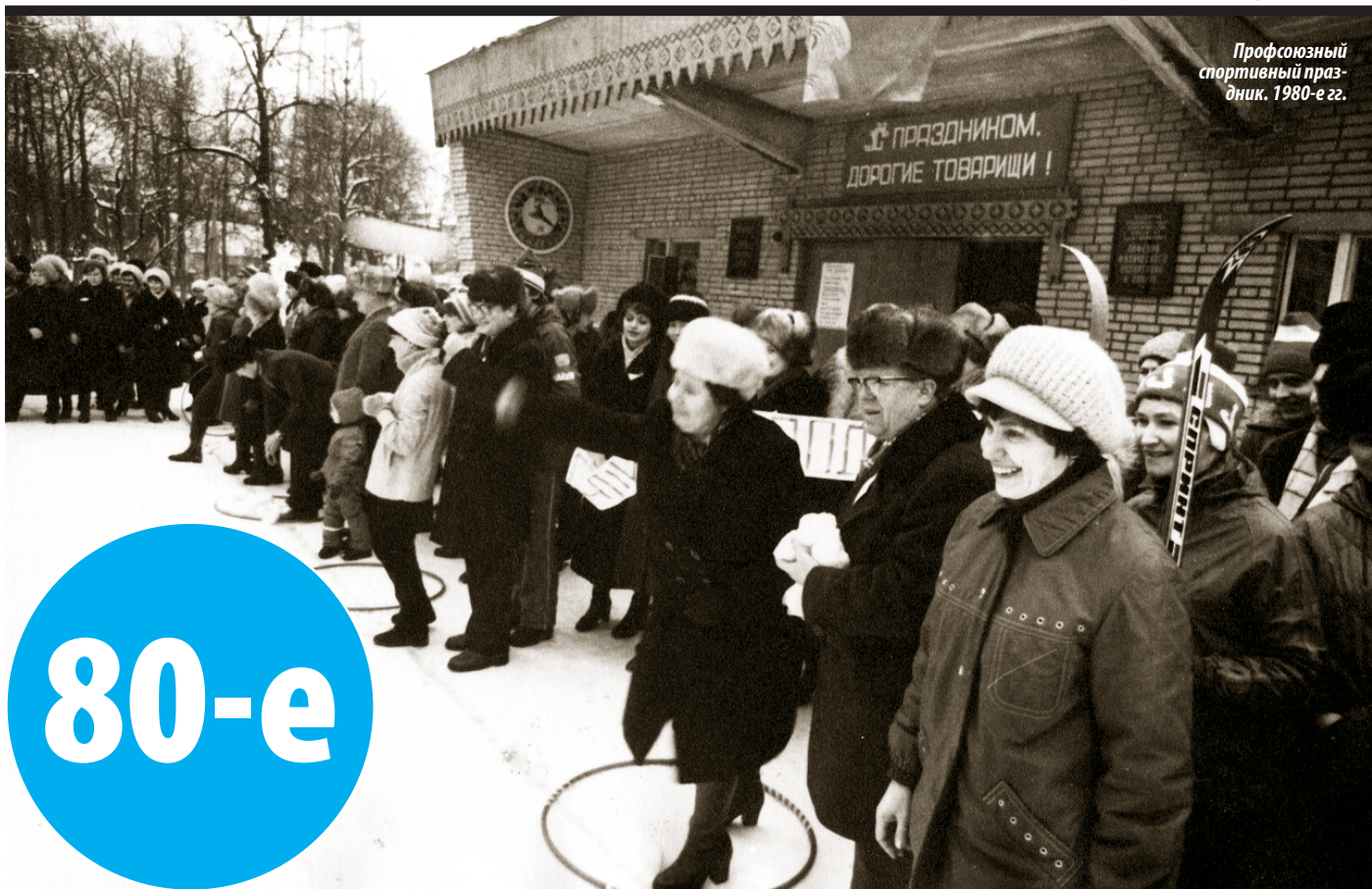
Профсоюзный спортивный праздник. 1980-е гг.