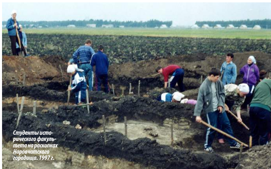
Студенты исторического факультета на раскопках Наровчатского городища. 1997 г.