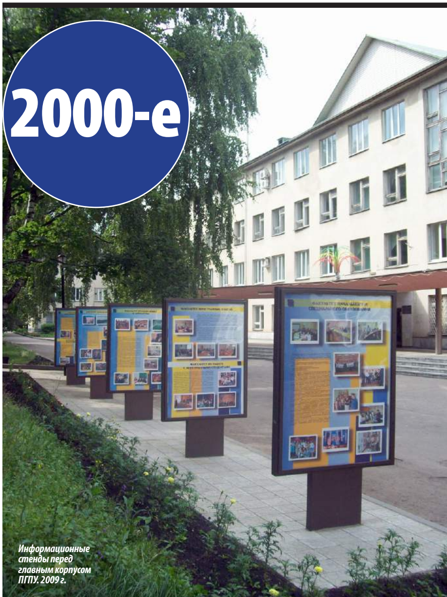
Информационные стенды перед главным корпусом ПГПУ. 2009 г.